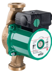
Simile alla figura